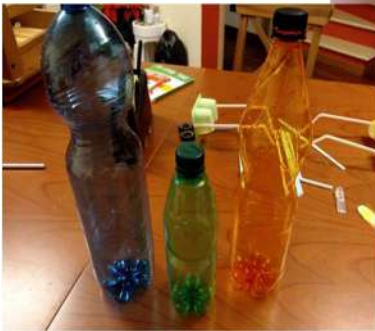
- Bottiglie di plastica di colori differenti